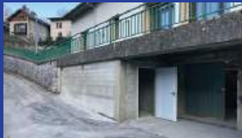
Nouveau local chaufferie.