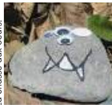
La chasse aux oeufs.