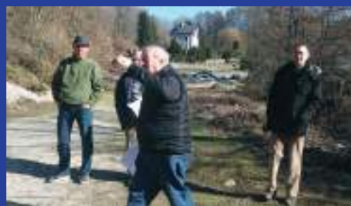
Les élus sur le terrain.