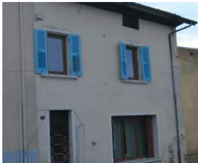
La coopé d'antan, habitation à présent.