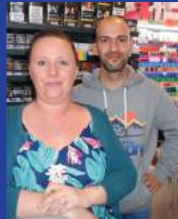
Les gérants du Proxi.