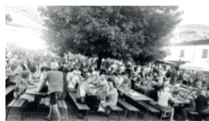
La fête du Molliet.

- Le vendredi 7 juillet , Grande Kermesse sur le stade, avec buvette, musique, frites, saucisses, jeux en tous genre : une fête pour toutes les habitants du village !