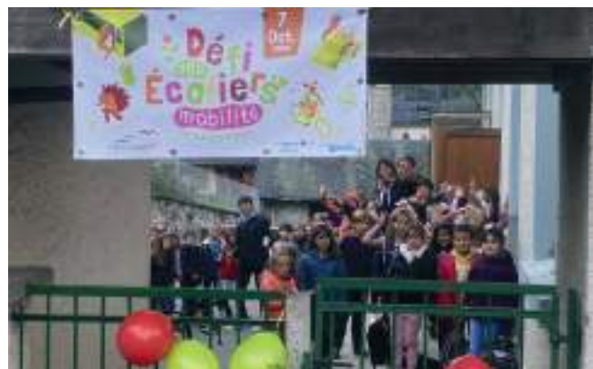
Journée mobilité des écoles.