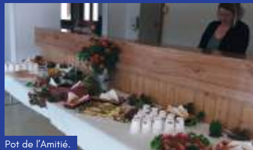
Pot de l'Amitié.