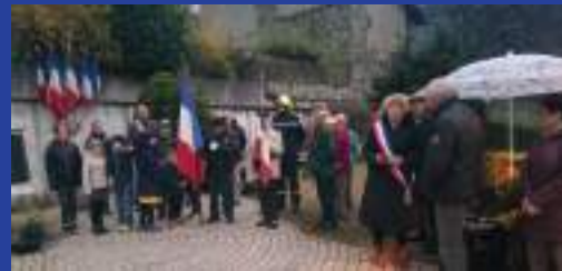
Commémoration du 19 mars 2023