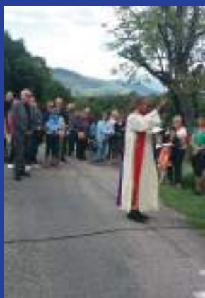
Bénédictio de la croix.