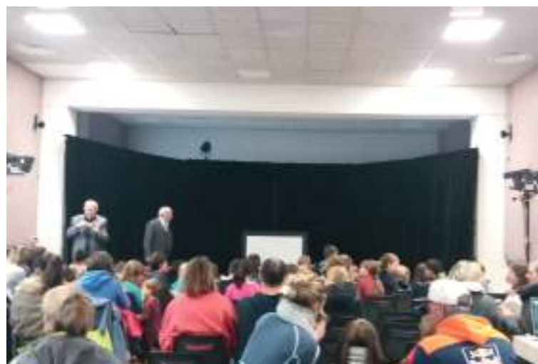
Spectacle à la bibliothèque.