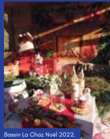
Bassin La Chaz Noël 2022.