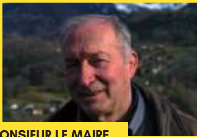
MONSIEUR LE MAIRE