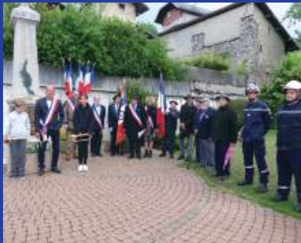
Commémoration du 8 Mai 2022.