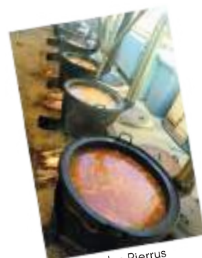
La soupe des Pierrus

Et bien sûr, la Soupe des Pierrus concoctée par l'équipe surentraînée des Chaudières aura lieu cette année le 5 août .