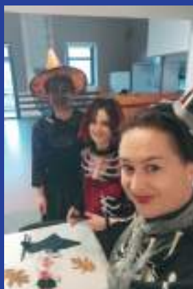
Périscolaire Halloween 2022.