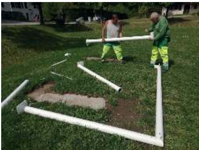
Montage des cages de foot