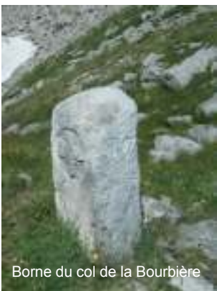
Borne du col de la Bourbière

Arvillard possède une seconde borne frontière au Col de la