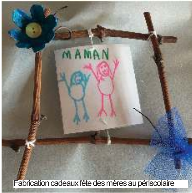
Fabrication cadeaux fête des mères au périscolaire