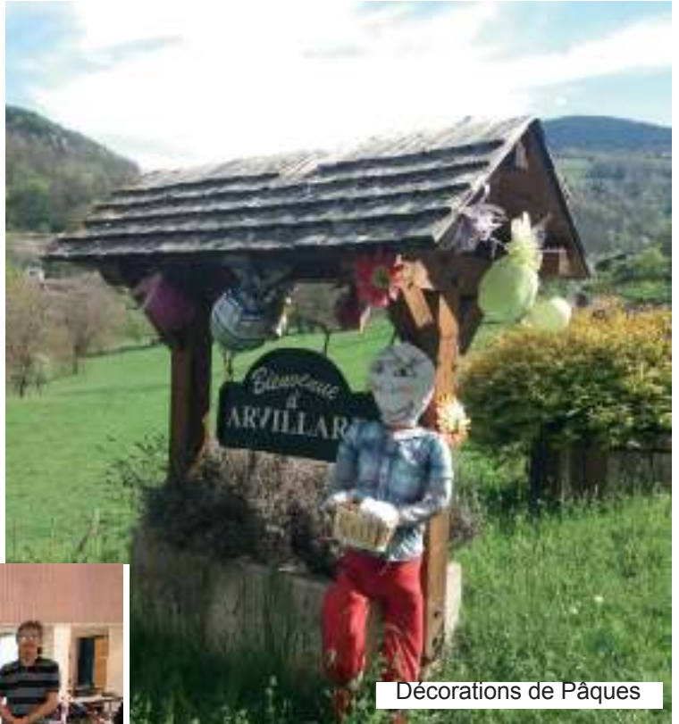
Décorations de Pâques