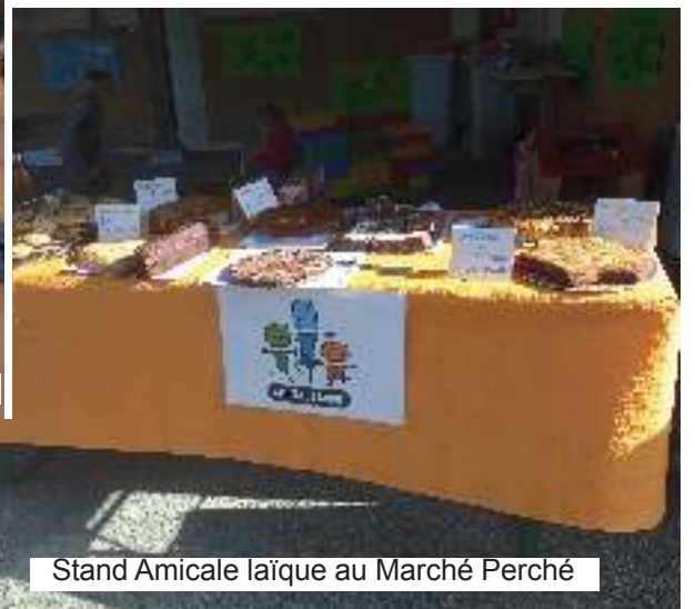
Stand Amicale laïque au Marché Perché