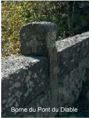
Borne du Pont du Diable

Le Pont du Diable, lieu emblématique d'Arvillard, qui surplombe le