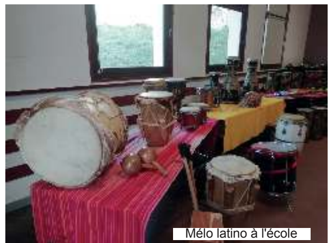
Mélo latino à l'école