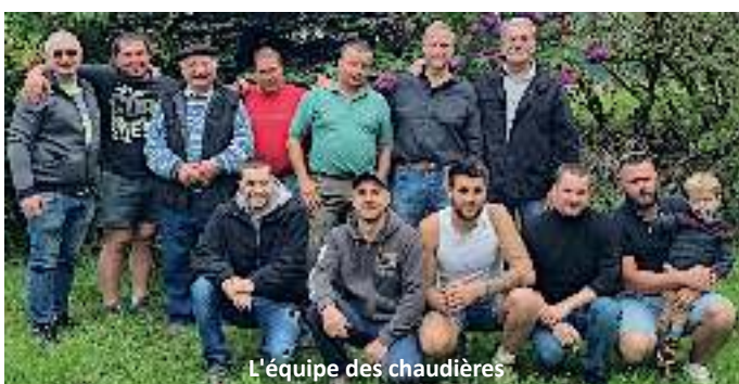
L'équipe des chaudières