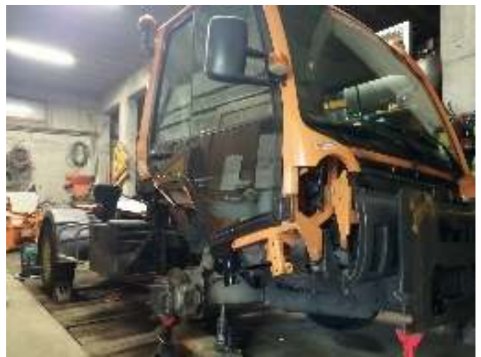
Entretien des véhicules communaux