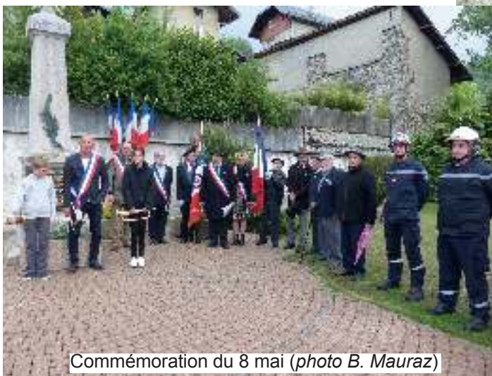
Commémoration du 8 mai